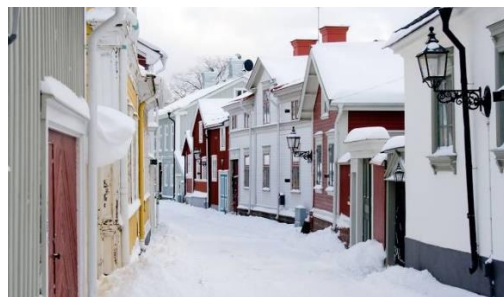
Vacker vy över äldre stadsdel i Gävle.