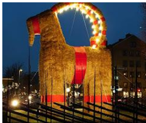
Kommer den att klara sig i år, den stiliga Gävlebocken?

Så igen – skynda att anmäla dig – du är så välkommen!