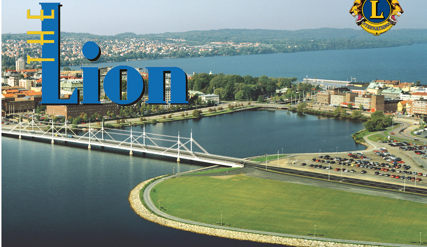
Vy över Jönköping, platsen för Lions Riksmöte 2007. I förgrunden den nya bron.