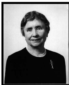
Helen Keller, född 27 juni 1880 i Alabama, USA. Hon var en amerikansk författare, aktivist och föreläsare. Hon var den första dövblinda person som avlade en akademisk examen. Under sitt liv publicerade hon många böcker och artiklar. Hon var även politiskt aktiv och verkade för kvinnors, funktionshindrade och arbetstagares rättigheter. Källa: Wikipedia