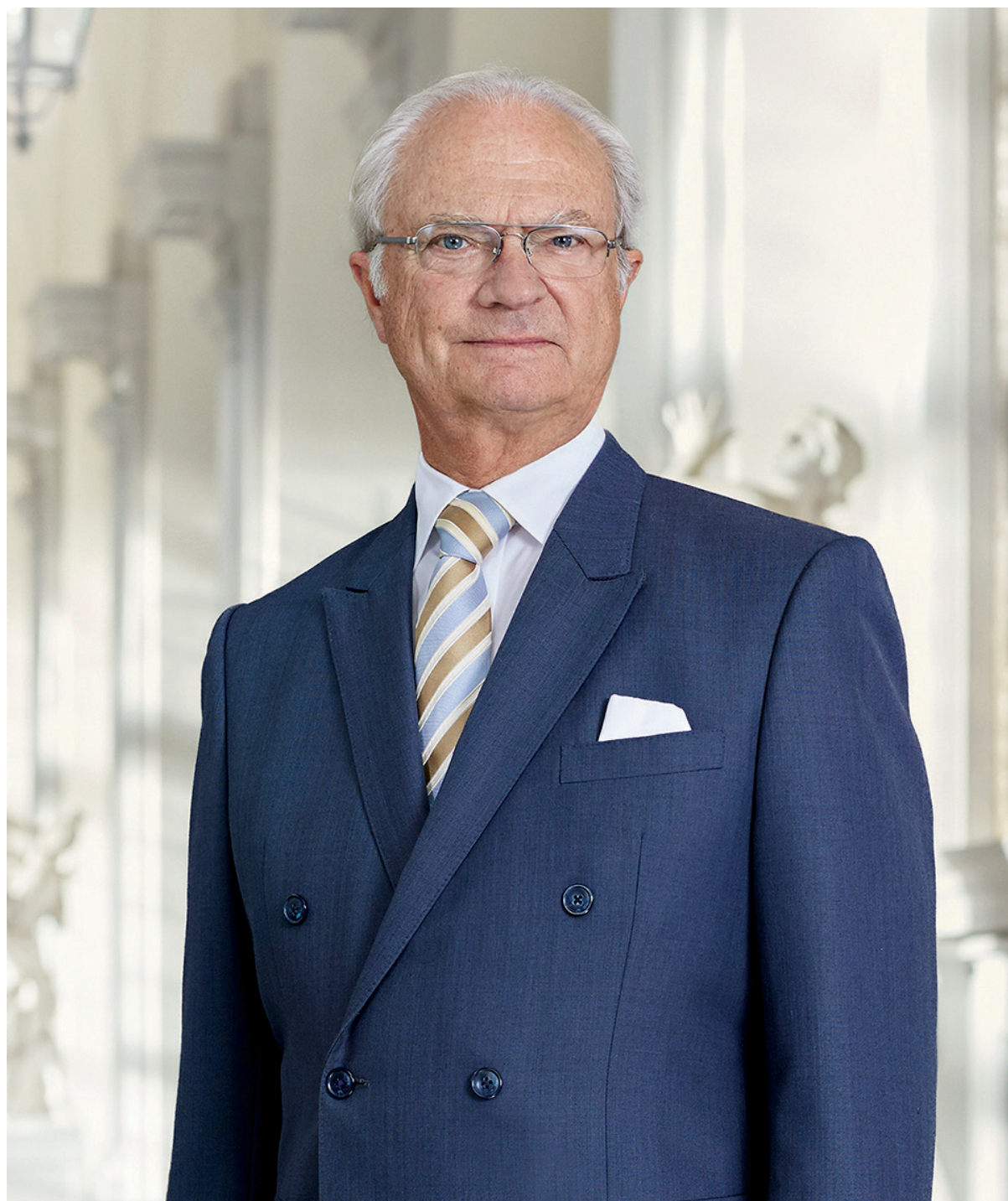
Hans Majestät Carl XVI Gustaf