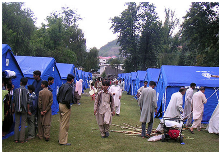
Lions tält i Pakistan efter en jordbävningen 2005.

Sedan dess har flera lionsmedlemmar antagits av MSB från hela landet. Vi har idag tio representanter varav tre är kvinnor. Lions och MSB genomförde en gemensam utbildning för Lionsrepresentanterna på Rosersberg i början av juni 2022.